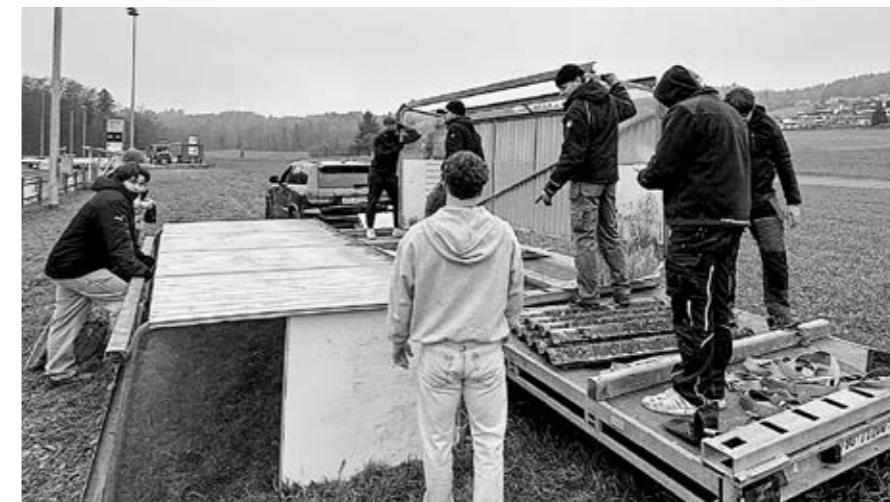
Nachdem ein Sturm die alten Spielerbänkli weggefegt hatte, haben die Jungs des FCR in Eigenregie neue gebaut.