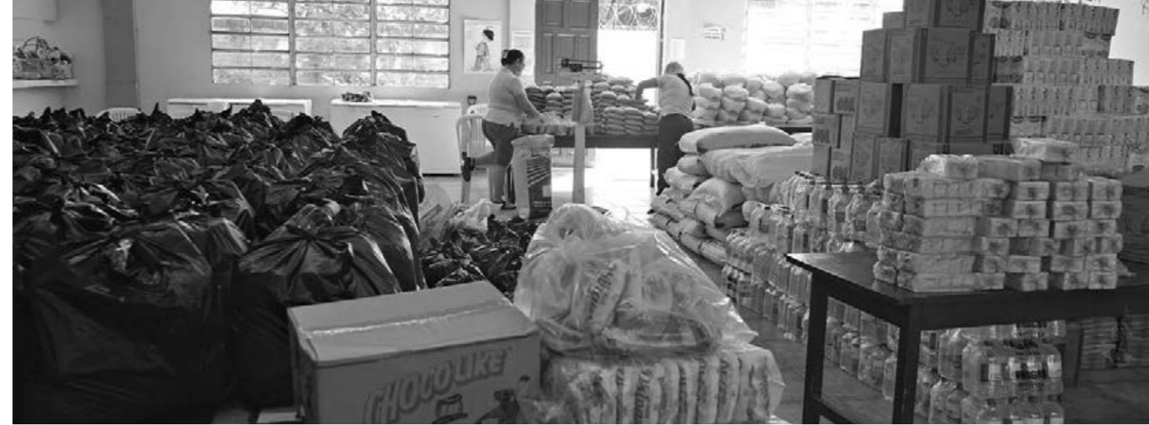
Wo sonst täglich über 200 Kinder zu Mittag essen, werden jetzt die Hilfspakete zusammengestellt.