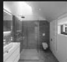
Badezimmer (neue Ausstellung)