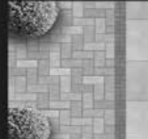
Gartenplatten & Verbundsteine (neue Ausstellung)