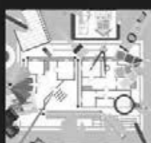
Bauleitung (bei Badumbauten)