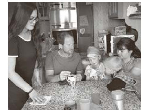
Impressionen aus dem Schul- und Praktikumsalltag.