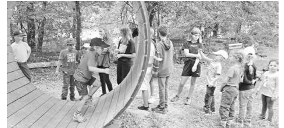
Das Team Riedholz

Bei der diesjährigen Herbstwanderung der Primarschule Riedholz trafen sich alle zum Mittagessen auf dem Spielplatz an der Emme in Derendingen. Die 3. bis 6. Klasse wanderte nach Solothurn, am Reitsportzentrum Steinerhof vorbei zum Schlösschen Bleichenberg und dann zum gemeinsamen Treffpunkt. Die Kinder des Kindergartens und der ersten und zweiten Klasse nahmen den Weg der Emme entlang nach Derendingen. Alle genossen diesen warmen Herbsttag und das gemeinsame Essen und Spielen.