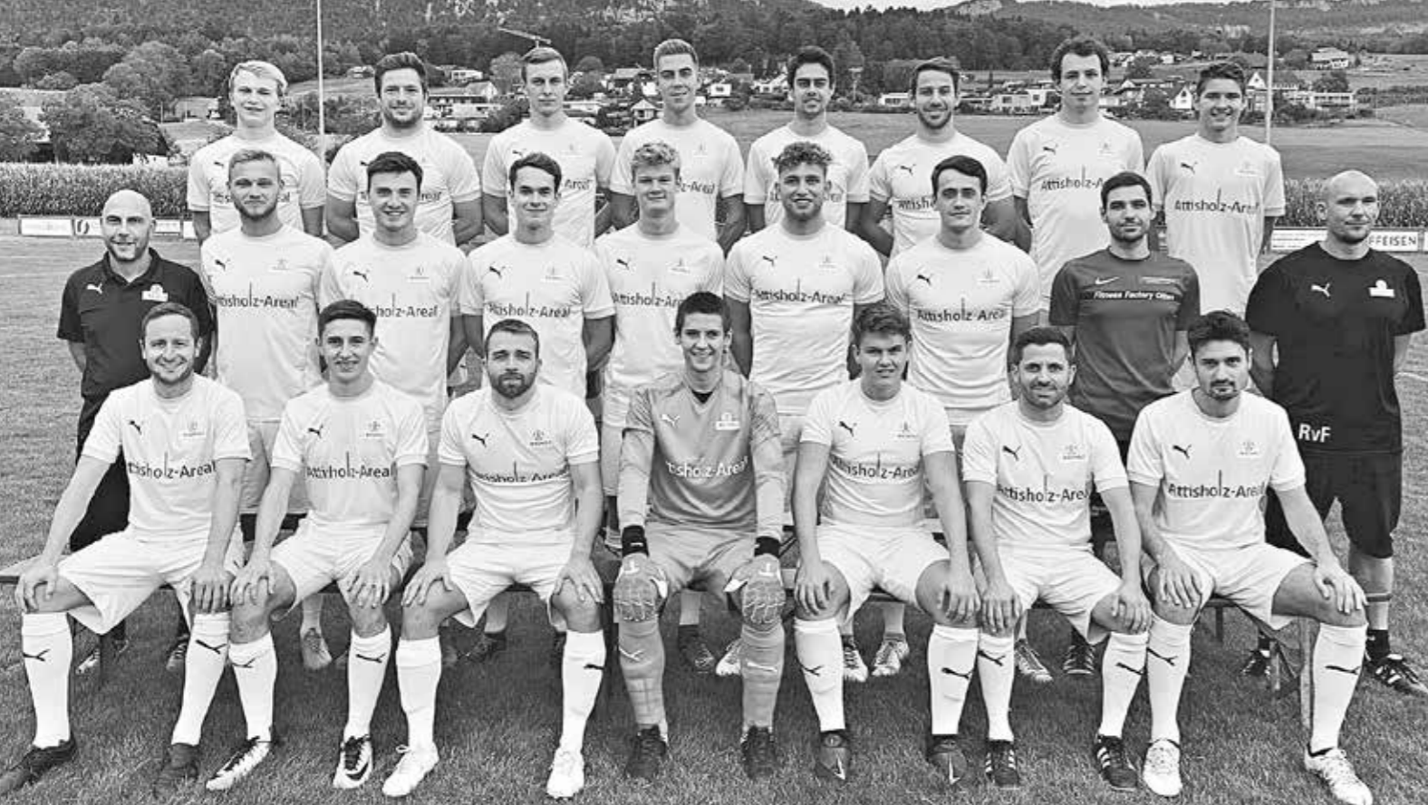
Die erste Mannschaft des FC Riedholz