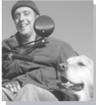
Liebe Leserin Lieber Leser

Nun wohne ich schon seit dem 1. April mit meinem 12 Jahre alten Golden Retriever und Begleithund «Funky» am Haldenweg. Vielleicht sind wir Ihnen schon auf einem unserer Spaziergänge begegnet. Funky hat eine spezielle Ausbildung genossen. Er kann mir die Türe öffnen, kleinere Einkäufe tragen oder mir einen Gegenstand aus einer für mich unzugänglichen Ecke apportieren. Als Rollstuhlfahrer habe ich in der Wohnung darauf geachtet, dass sie nach meinen Bedürfnissen angepasst und eingerichtet wird. Auf den ersten Blick unterscheidet sie sich nicht gross von einer herkömmlichen Wohnung. Die Garderobe hängt etwas tiefer, damit ich meine Jacken vom Rollstuhl aus mühelos aufhängen kann. In der Küche sind Kochfeld und Spülbecken unterfahrbar. Die Oberschränke wurden mit einem Lift-System ausgerüstet. Damit lassen sich die Tablare aus dem Schrank hinunter auf die Kombination ziehen. So kann ich jede Schüssel und Tasse gut erreichen. In meinem Badezimmer verzichtete ich auf eine Badewanne. Dafür findet man dort eine grosse Duschzelle mit Klappsitz und Haltestange. Hinter dem Lavabo hängt ein hoher Wandspiegel. So sehe ich frühmorgens mein sitzendes Spiegelbild und davon profitieren schliesslich wenig später auch meine